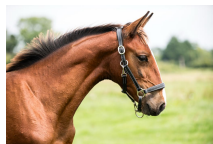
PREMIUM ROC LA PHOTO EST DATÉE DU 8 AOÛT 2025