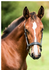
PREMIUM ROC LA PHOTO EST DATÉE DU 8 AOÛT 2025

Trainer : Thomas LEVESQUE Broken in : No