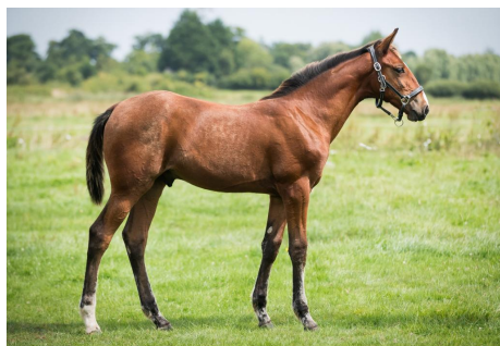
PREMIUM ROC LA PHOTO EST DATÉE DU 8 AOÛT 2025